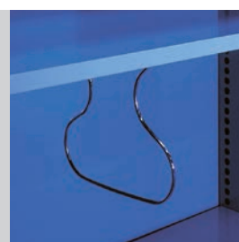
Trennbügel zur Abstützung von Büchern und Ordnern.