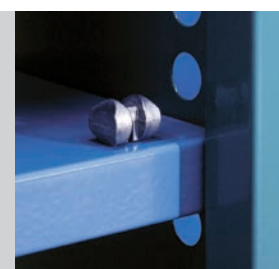
Tablarträger zur schraubenlosen Montage.

anstelle von Rückwänden dienen zur Stabilisierung der Regaleinheit.